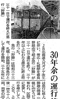
30年余の運行終了 「狩勝」

【十勝毎日新聞記者 岩田慶昭が札幌から取材】 帯広―札幌間の新特急「とかち」が発車した。従来の「おおぞら」より約15分短縮された。また、帯広―札幌間の所要時間は、従来の「おおぞら」より約15分短縮された。また、帯広―札幌間の所要時間は、従来の「おおぞら」より約15分短縮された。